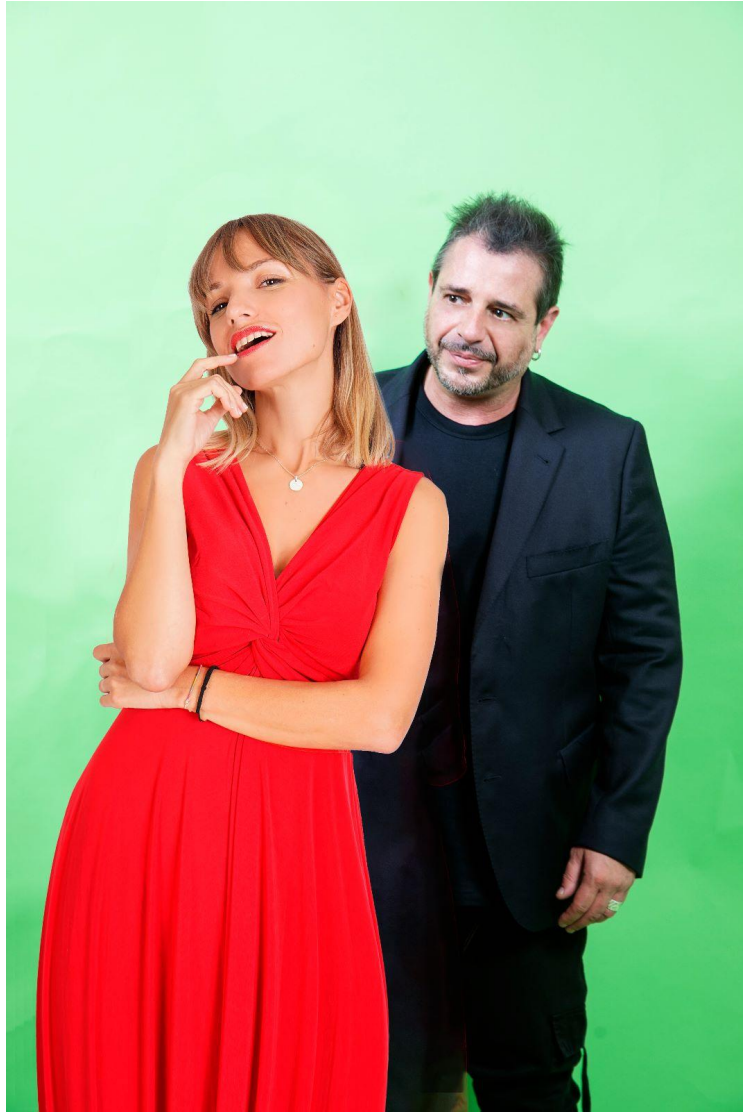
Coitus la comedia